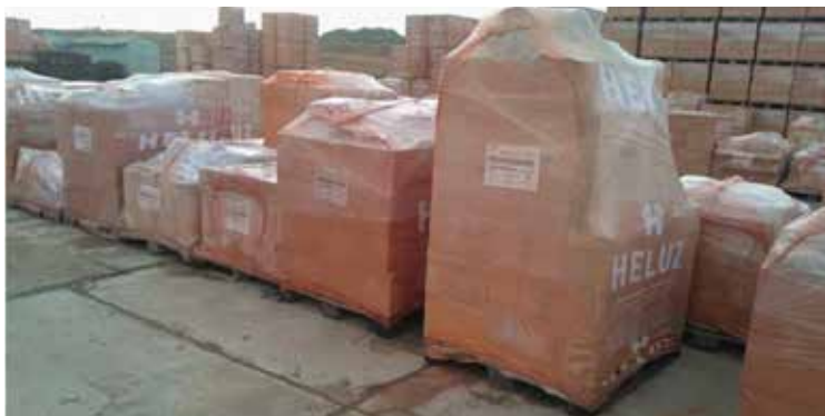
Obr. 12 Ukázka skladování komínových sestav