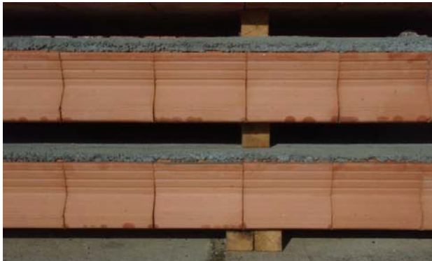
Obr. 10 První panel ve skládce se podkládá dvěma proklady