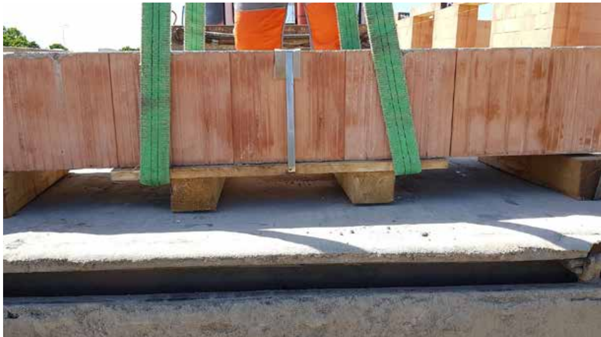
Obr. 6 Ukázka správné manipulace překladu – provlečení popruhů manipulační paletou.

Překlady se manipulují vysokozdvížným vozíkem či C závěsem vždy s paletou překladu. Paletovací vidle se umísťují na vnější stranu od hranolů palety. Při zabudovávání překladů se používá C závěs nebo textilní popruhy, která se provlíknou pod paletou od vnější strany hranolů palety. Jiný typ zavěšení či manipulace může vést k poškození překladu.