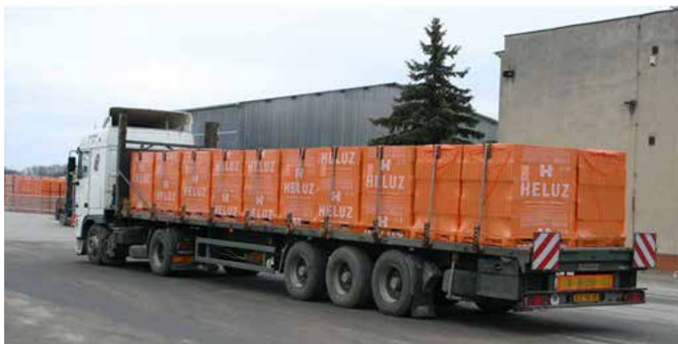
Obr. Pohled na řádně naložené palety s cihlami na nákladním automobilu

Druhé vyhotovení dodacího listu bez označení razítka bude odesláno společně se zbožím příjemci.