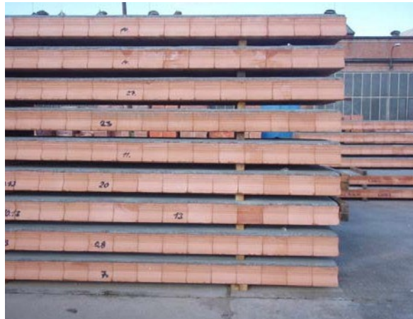
Obr. 11 Proklady mezi jednotlivými panely se umísťují ve svislici nad sebou