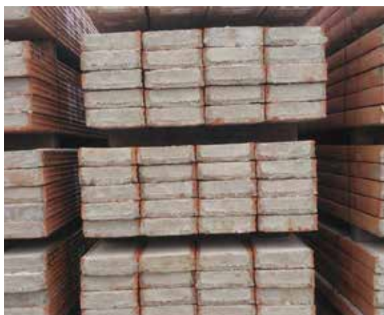
Obr. 1 Pohled na ucelený paket překladů HELUZ 23,8