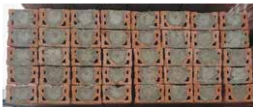
Obr. 3 Paket s plochými překlady šířky 115 mm