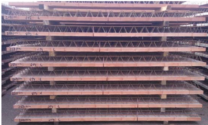
Obr. 8 Správná poloha umístění prokladů Obr. 7 Ukázka slohy stropních nosníků

Stropní nosníky se na skládce zpravidla podepírají dřevěnými proklady 8 x 8 x 103 cm, bývá až 6 ks nosníků v jedné řadě, nosníky délky do 625 cm (výška nosníků 17,5 cm) maximálně v 8 řadách (to je cca výška slohy 2,0 m), nosníky délky od 650 do 825 cm (výška nosníků 23 cm) maximálně v 6 řadách (to je cca výška slohy 1,9 m), pokud je zajištěna stabilita slohy jako celku (skladované nosníky musí být zabezpečeny proti sesutí či posunutí).