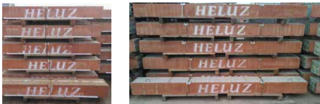
Obr. 7 Roletové překlady na skládce, vlevo do délky 250 cm (jedna paleta), vpravo od délky 275 cm

V zimním období je potřeba prvky chránit před nasáknutím vodou a před mrazem.