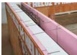
Uloží se výztuž věnce.