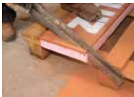
Tvarovky lze snadno a precizně opracovat.