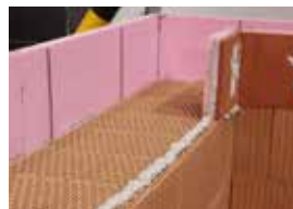
Nejprve se zdí na vnějším líci zdiva a poté na vnitřním.