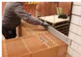
Kontrola rovinnosti zdiva.