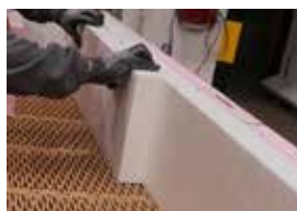
Pomocí PU pěny se na polystyrem přilepí tepelná izolace věnce.