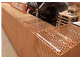
Tvarovky se zdí na PU pěnu HELUZ.