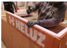
Založení rohů a stabilizace tvarovek pomocí natloukacích kotev.