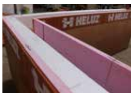
Tepelná izolace je položena, zkontroluje se těsnost styčných spár na vnitřní straně věnce.