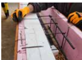
Před betonáží se vrchní strana spojí sponami, které se zaklepou do úrovně horní hrany věnce.